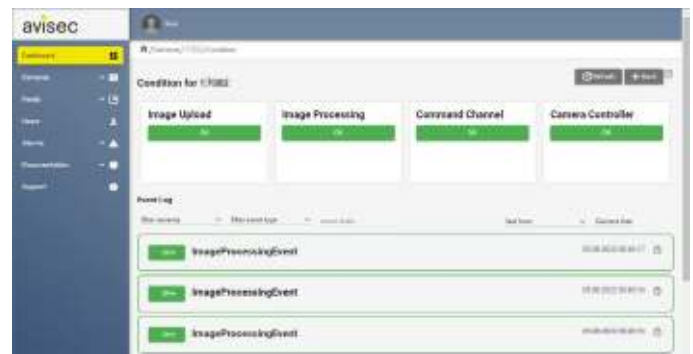
Abbildung 1: Ereignisüberwachung auf Kamera

Die Alarmierung basiert auf den im Portal bereits verfügbaren Überwachungsmöglichkeiten. Es können Bildübertragung, Bildverarbeitung und Kamerasteuerung überwacht werden. Tritt eine Störung auf, wirst du automatisch benachrichtigt.