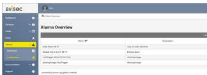
Abbildung 3: «Alarm Konfiguration»

Die Bilderfassung und Übertragung von der Kamera zur avisec-Cloud wird überwacht. Fehlende Bildaufnahmen lösen ebenfalls einen Alarm aus.